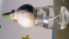
A nedvesség, fény és meleg elindítja a fejlődést, kibújnak a gyökerek, duzzad a rügy.