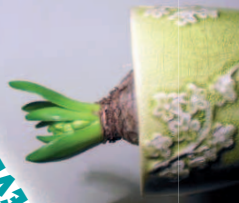
Növekednek a levelek, és bimbóba rejtve a virágok.