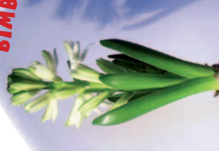
Készülődnek a virágok, már csak pár nap, és ki-bomlanak.