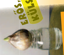
A virághagyma téli ál-mát aludta a föld alatt, sőtétben és hidegben.